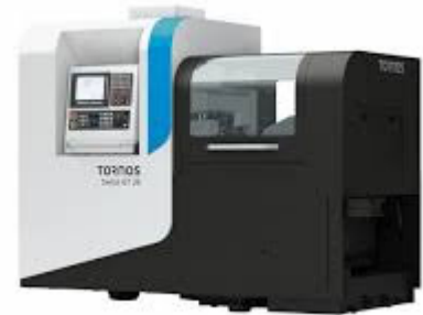
Tornos GT 26B